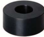
Mutter für T-Nut slide block écrou pour rainure T