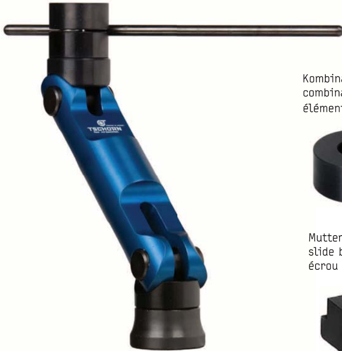
Kombinationselement combination element élément à combinaison